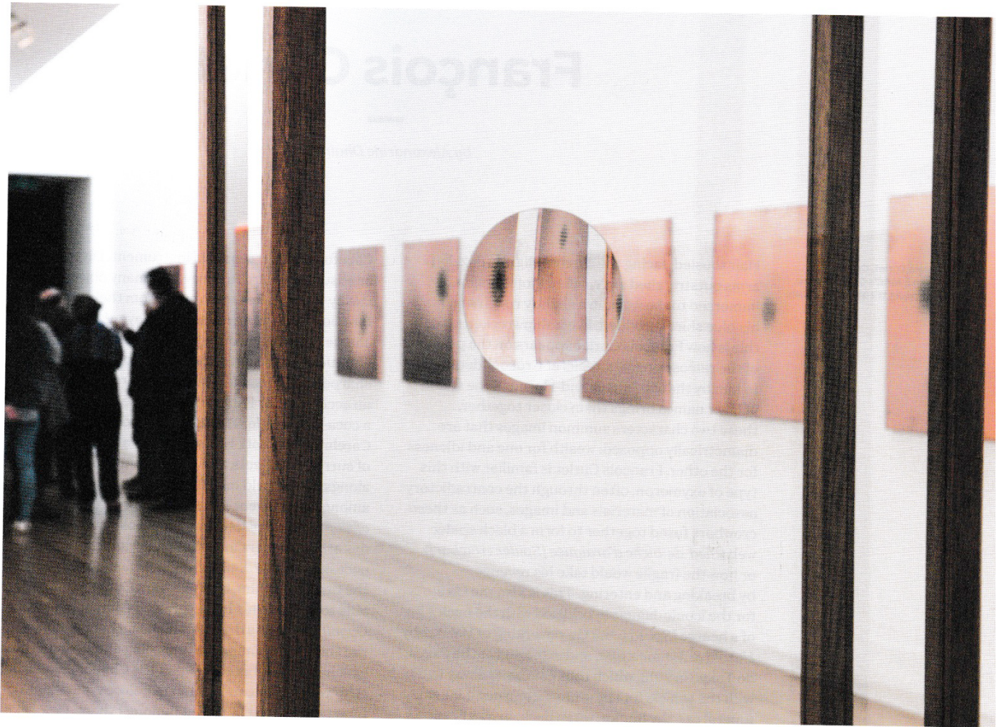
François Curlet, Vitrine, 1992. Chêne, verre, loupes / Oak, glass, magnifying glass, 200 × 110 × 60 cm. Vue de l'exposition au MAC's / View of the exhibition at the MAC's.

Curlet est un désillusionniste, il agit comme un véritable antidote cynique, une paire de lunettes d' Invasion Los Angeles à lui tout seul. Ses attrape-rêves n'attrapent plus guère que des rebuts, morceaux d'emballages triviaux de chewing-gum, de biscuits ou de médicaments ( Trash-Catchers ). Même le white cube n'est finalement qu'un paquet de biscuits, avec son sigle en forme de triangle rouge placé dans l'angle d'un mur ( Nabisco ), histoire de ne pas oublier que le centre d'art ou le musée est un produit commercial comme un autre.