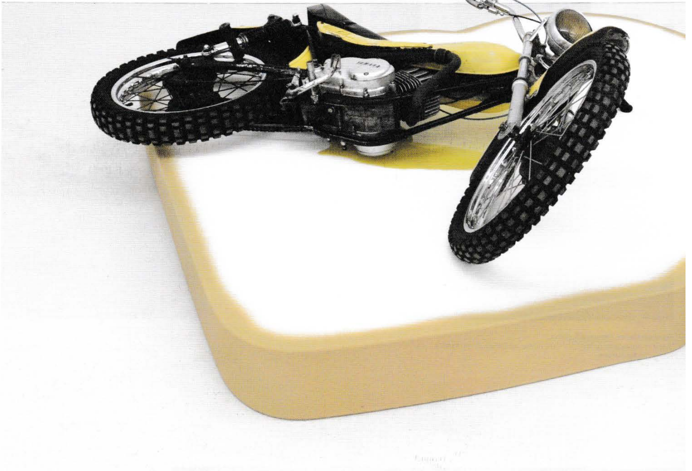
François Curlet, Toast cannibale , 2014. Moto, mousse, résine / Bike, foam, resin, ca. 50 × 220 × 200 cm. Collection Centre national des arts plastiques, Paris.

sculptures, moulded glass suitcases containing intimate objects as they appear on the airport control screen. This transparent whole also gave rise to one of Curlet's emblematic pieces, Chaquarium [ Catank ]. This bleak diorama, without water but with bubbles, which shelters behind a glass pane a real Persian cat (fed and watered, let's calm down), having for only company a giant aquarium coral and a Cococat , a coconut-shaped refuge sculpture (that Curlet also declined for humans), reverses the roles between aquatic prey and hairy predator, for a pathetic and funny spectacle. In the parallel world of social networks, immateriality and flow