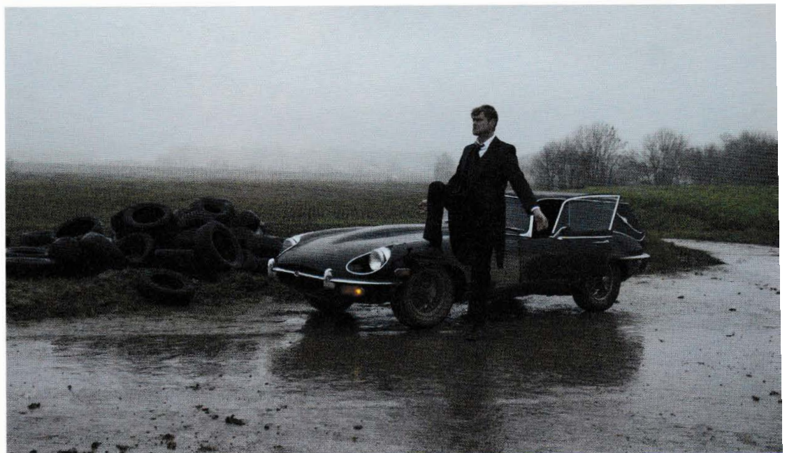
François Curlet, Jonathan Livingston , 2013. Film HD, 8'20".