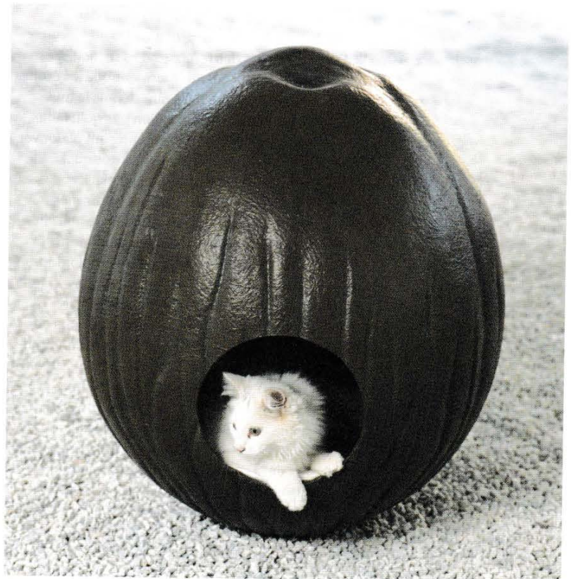
François Curlet, Cococat , 2001. Fibre de verre, résine, tissu, mousse / Glass fiber, resin, fabric, foam, ca 70 × 60 × 50 cm.