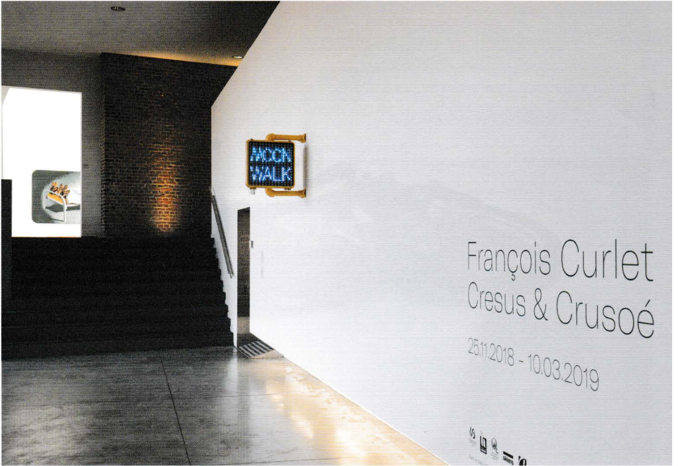
François Curlet, Moonwalk, 2003. Vue de l'exposition au MAC's / View of the exhibition at the MAC's.